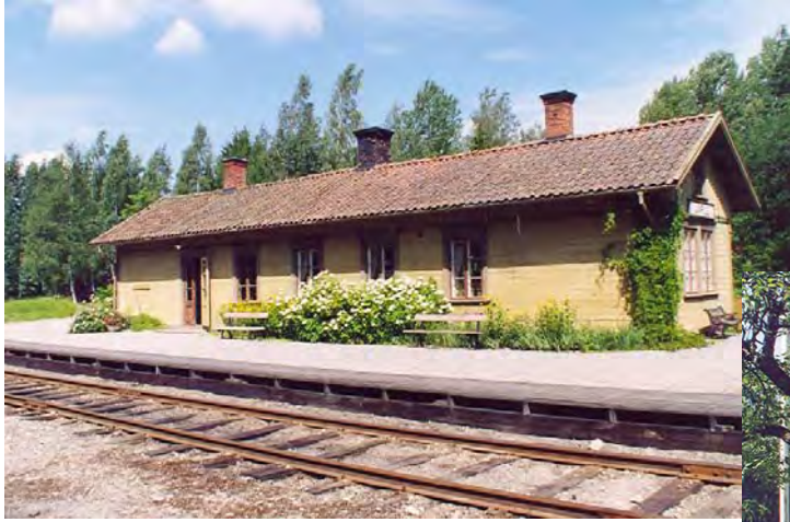
Stationsbyggnaden vid Järlestation.

Byggnadens exteriör är troligen ursprunglig eller möjligen från en renovering i slutet av 1880-talet. 1 Vissa avvikelser från ursprunglig ritning finns i fasaden när det gäller tex. fönster och dörrplaceringar.