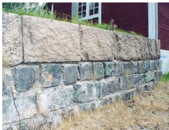
Lastkaj av granit och sindersten.

Vid Järle station gick inte utvecklingen som planerat, troligtvis på grund av att stationen placerats felaktigt. Det fanns avancerade planer på att flytta stationen norrut, över bron till korsningen med Lindes landsväg där Lilla Mons banvaktstuga låg. Den ekonomiska situationen gjorde inte en flytt möjlig. 1889 byggdes en fabrik för torvströframställning strax söder om stationen i Järle. Samtliga produkter från fabriken transporterades med tåg och snart anlades ett sidospår till fabriken. Strax norr om stationen växte vid sekelskiftet upp flera bostadshus som en följd av verksamheten vid järnvägen och torvindustrin. 3