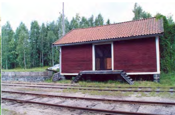
Godsmagasin vid Järle station.

Vid Järle station gick inte utvecklingen som planerat, troligtvis på grund av att stationen placerats felaktigt. Det fanns avancerade planer på att flytta stationen norrut, över bron till korsningen med Lindes landsväg där Lilla Mons banvaktstuga låg. Den ekonomiska situationen gjorde inte en flytt möjlig. 1889 byggdes en fabrik för torvströframställning strax söder om stationen i Järle. Samtliga produkter från fabriken transporterades med tåg och snart anlades ett sidospår till fabriken. Strax norr om stationen växte vid sekelskiftet upp flera bostadshus som en följd av verksamheten vid järnvägen och torvindustrin. 3