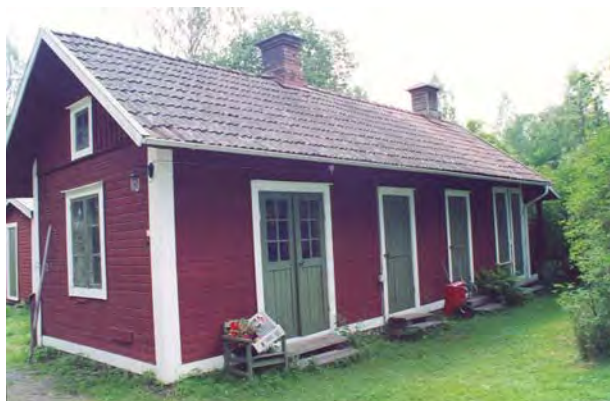
Uthus vid Järle station.

Vid Järle uppfördes också godsmagasin, jordkällare och uthus med förråd, avträde och tvättstuga. Samtliga byggnader finns bevarade än idag.