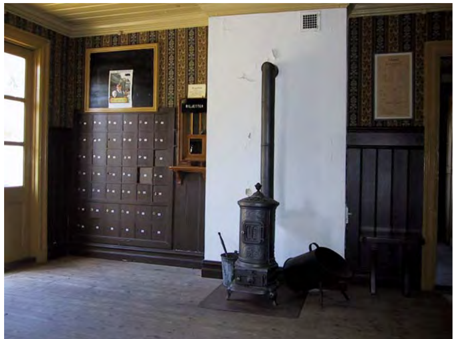
Järlestation och spårrområde.

Interiört har planlösningar och inredning genomgått några mindre förändringar. 1984-85 genomfördes ett omfattande in- och utvändigt upprustnings- och restaureringsarbete. I samband med detta moderniserades lägenhetsdelen för att kunna användas som såväl föreningslokal som bostad. 2