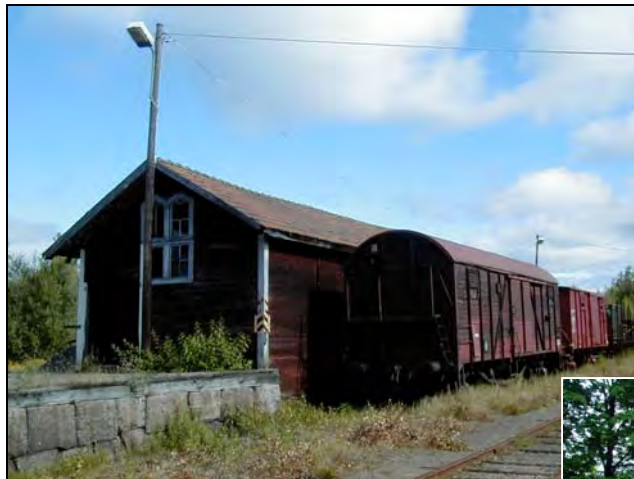
Godsmagasin och i förgrunden syns lastkajen i buggen sten. Åt höger det nyare godsmagasinet.

Godsmagasinet, uppfört 1874, finns fortfarande kvar inom stationsområdet. Den rödfärgade träbyggnaden med goticerande fönster på gavelröstena renoverades även den 1999. Intill denna ligger ett yngre godsmagasin sannolikt tillkommet på 1940-talet. Stationen bytte 1979 namn till Nora - Gyttorps station då Nora station lades ned. 4