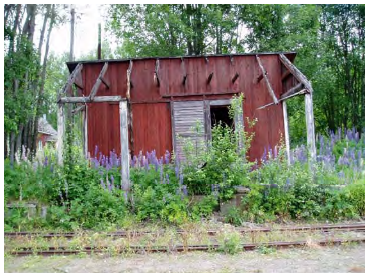
Lagerutrymme med spår i förgrunden.

Den gamla lastkajen och det förfallna lagerutrymmet. Lagerutrymmet har stående spontad panel och kvar finns även en skjutdörr i trä.