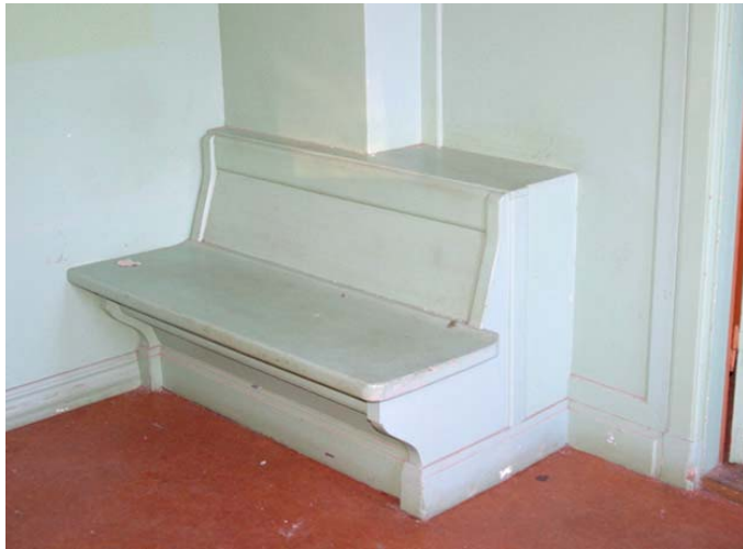
I bottenvåningen finns fastinredning i form av bänkar och biljettlucka i väntsalen bevarad.