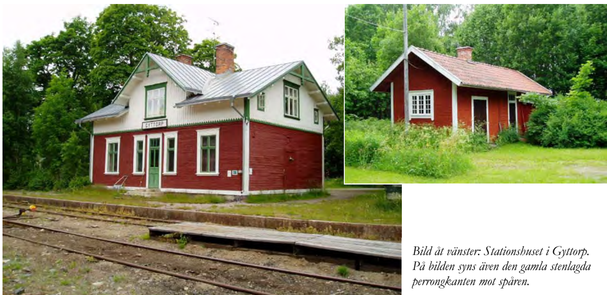
Bild åt vänster: Stationshuset i Gyttorp. På bilden syns även den gamla stenlagda perrongkanten mot spåren.